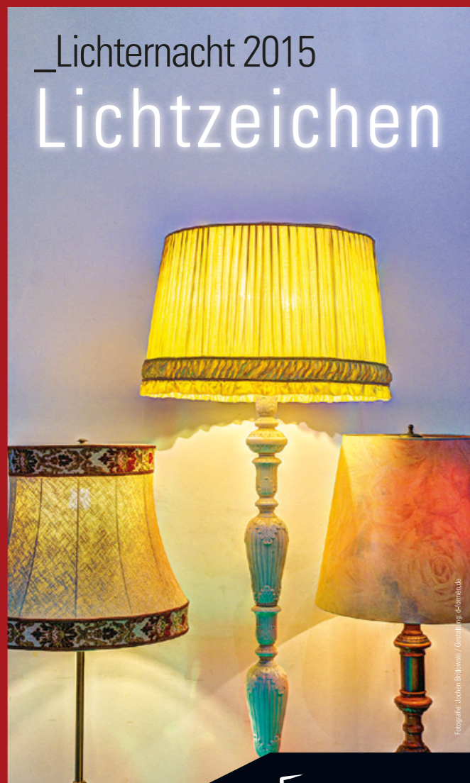
Fotografie: Jochen Bittrowski / Gestaltung: efermacade

An den Güterhallen dreht sich in diesem Jahr alles um das Thema „Lichtzeichen“.